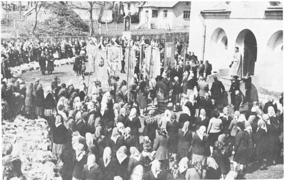
Церква у Вербові. Свячення пасок.