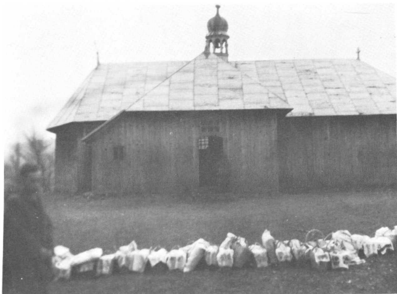
Тимчасова церква в Біщу, яка побудована 1930 року. Свячення пасок під церквою 1958 року.