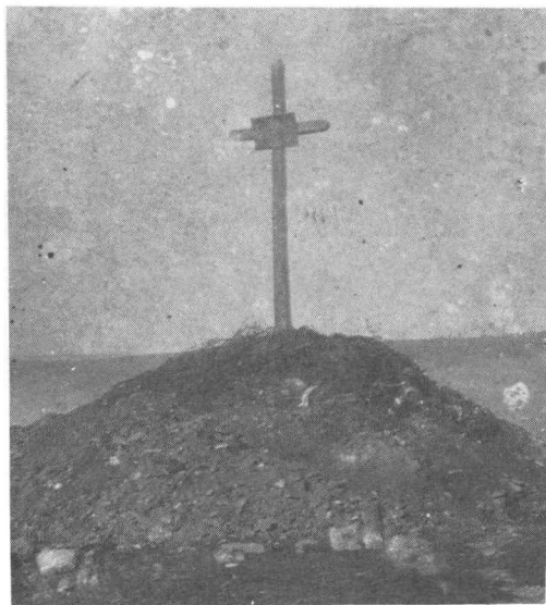
Могина на горі Лисоні