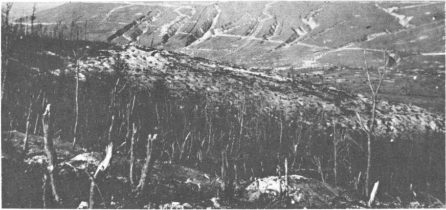
Загально знана гора Лисоня; там вславилися Українські Січові Стрільці, але багато їх — загинули. Світлина з 1916 р.