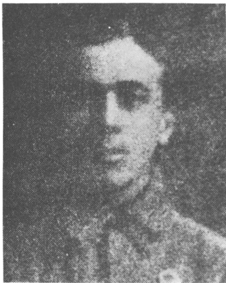
Петро Сагайдачний, УСС від 1914 р., попав у полон, опісля як сотн. СС був учасником усіх важливих подій відновлення укр. державности.