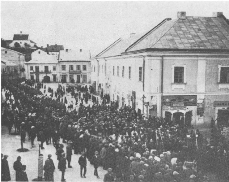
Похід Луговиків крізь ринок у Бережанах на площу вправ. Лугове свято в 1927 р.