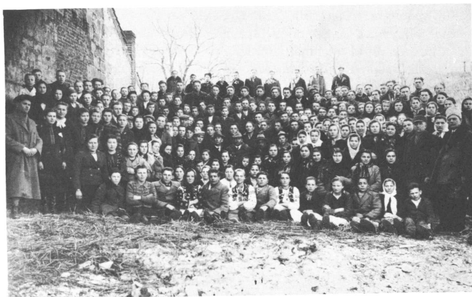
Хліборобський вишкіл молоді в Бережанах за часів нім. окупації.