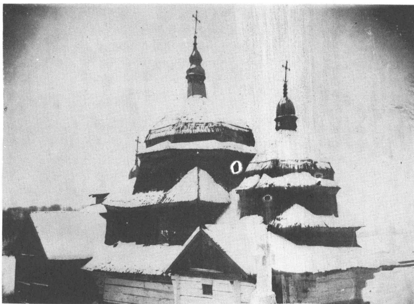
Старенька, дерев'яна церква в селі Шумлянях, засніжена взимку.