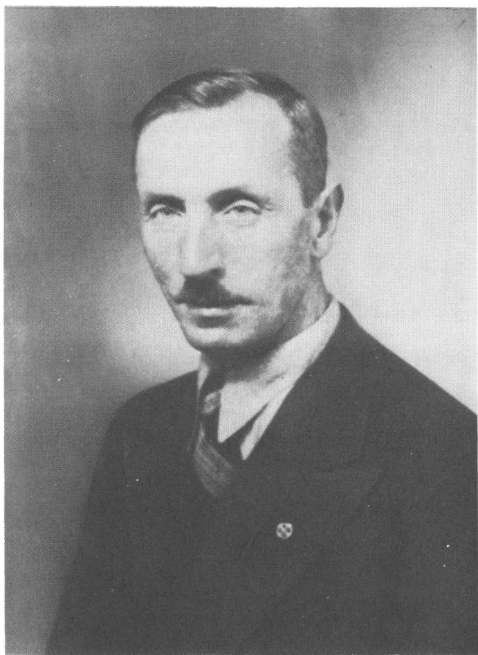
СЛ. П. Д-Р ВОЛОДИМИР БЕМКО Нар. 16 вересня 1889 р. в містечку Козові — помер 15 серпня 1965 р. в Нью-Йорку, похований на цвинтарі Hollywood Cemetery в Union, N.J., U.S.A.